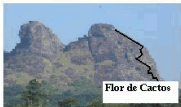
Flor de Cactos